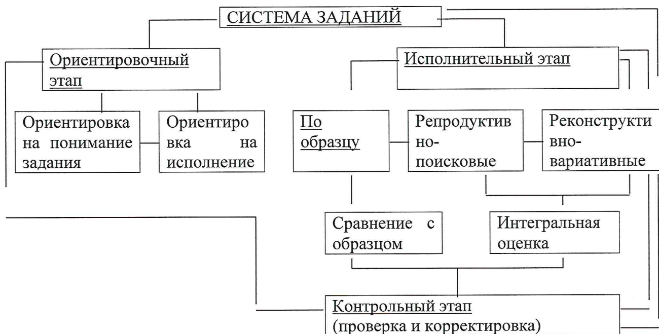
Рисунок 1 – Процесс формирования тактической подготовленности спортсмена

Задания реконструктивно-вариативного характера предполагают активную деятельность спортсмена по моделированию ситуаций соревновательной деятельности и использованию в этих ситуациях адекватных технико-тактических действий.